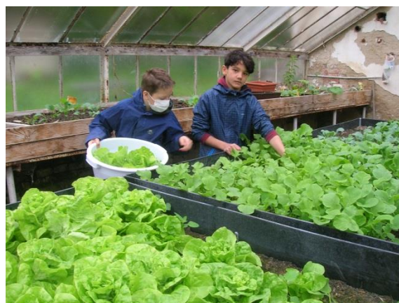
Projekt Zdravá výživa