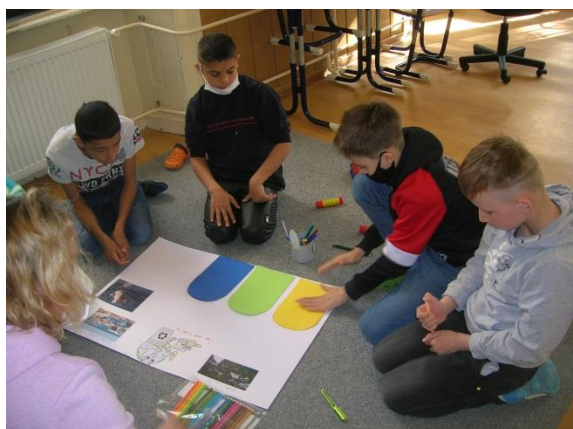
Projekt Den Země